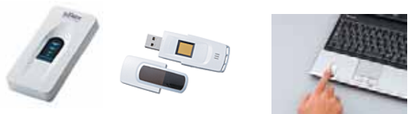
【指紋認証機器の例】

その他、セキュリティに関するシステム構築を外部へ委託したり、ISOやプライバシーマークの取得と同時にシステムの構築を依頼したりと、上手く専門コンサルタントを活用できる例が増えています。