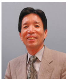
編集責任者 松本幸雄

株式会社マネジメントセンター 〒310-0844 茨城県水戸市住吉町 97-2 MSKビル 2F TEL029-246-4671 FAX029-246-4672 URL : http://www.isommc.com/