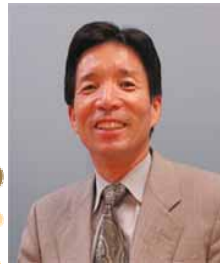
編集責任者 松本幸雄